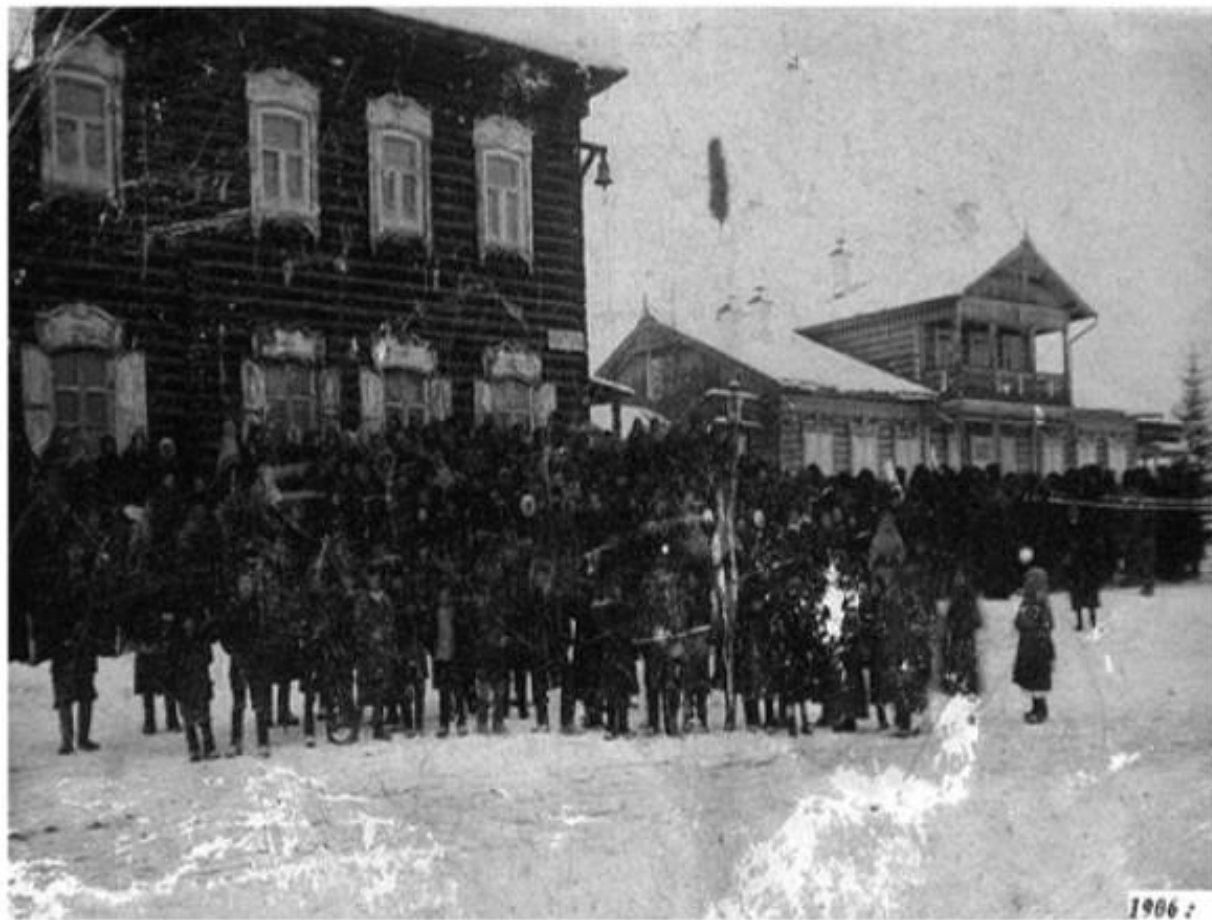
Фото 1906 г.