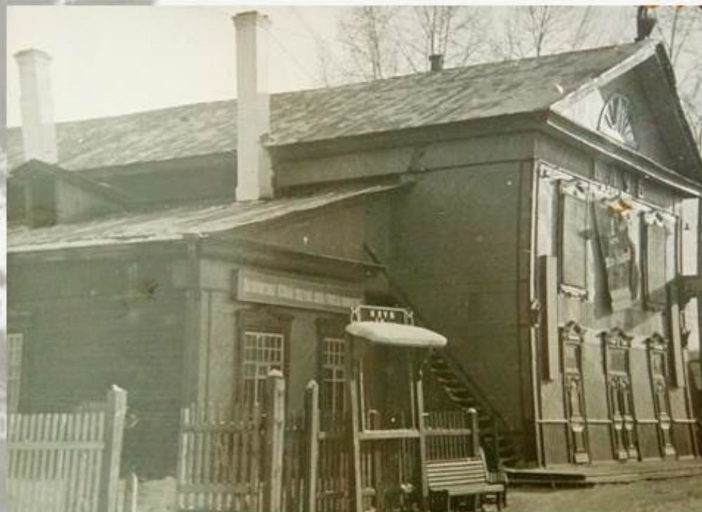
Рабочий клуб имени Карла Маркса.

Одной из достопримечательностей поселка является Дом культуры, построенный в начале XX века. Для строительства нового клуба вербовали плотницкие бригады по всей Иркутской области; был заложен фундамент, и началось строительство рабочего клуба методом народной стройки. Строительство было завершено в 1918 году, а торжественное открытие было назначено на встречу Нового 1919 года.