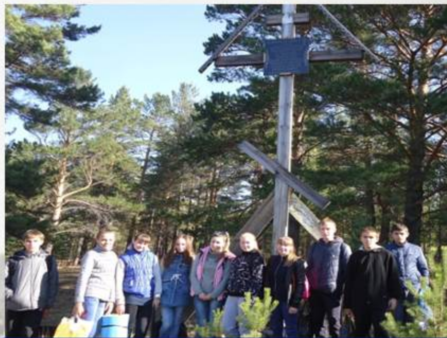
Восстановленный крест на месте гибели И.Д. Перевалова. Фото 2013 г.

В 1907 г. И. Д. Перевалов был убит в Узком месте, когда возвращался с Половины, при нем было жидкое золото и 2000 рублей. Из воспоминания Нестеренко Н.С.: «раздались два выстрела, послышался плач девочки с криком «папу убили». В метрах десяти от дороги лежал убитый Перевалов. Кучера, управлявшего лошадьми, не было. На том месте, где был убит Перевалов, был поставлен крест. Рабочие фабрики к убийству Перевалова отнеслись с сожалением».