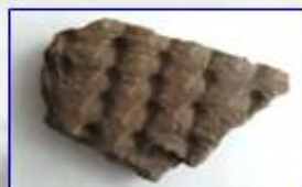
Керамика с оттисками рубчатой лопатки