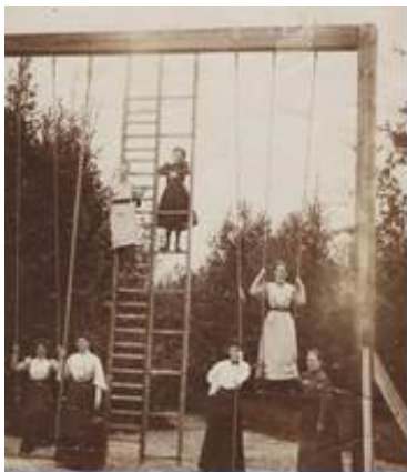
Качели в саду