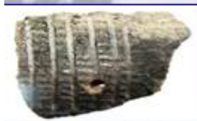
Керамика с оттисками сетки-плетенки