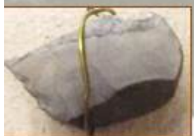
Скребло из камня мезолит-неолит