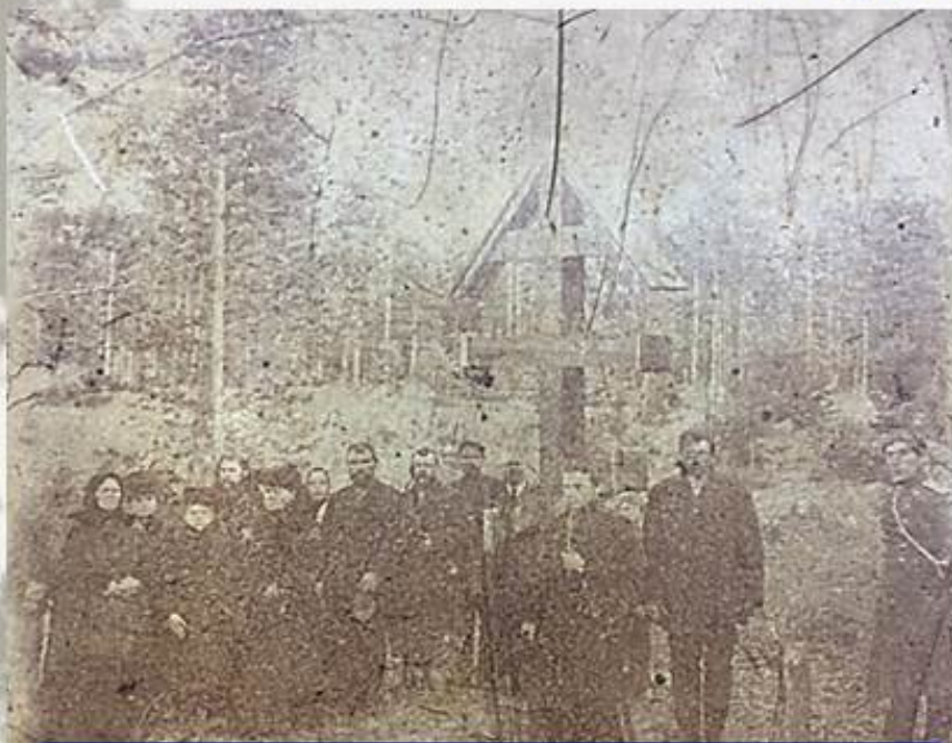
Крест на месте гибели Ивана Даниловича Перевалова. Начало XX века.