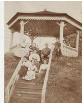
Беседка в саду