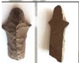
Тесло с ушками