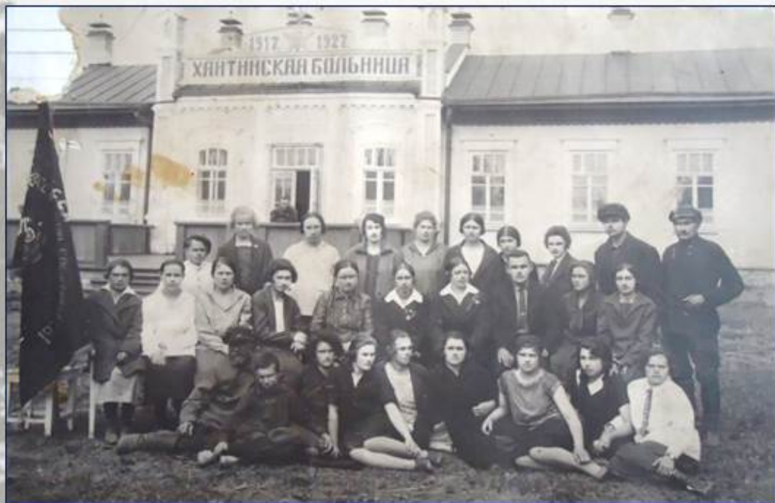
Здание больницы, построенное в 1927 г.

Четвёртая – Северная часть посёлка Мишелёвка – самая молодая. Строительство первых жилых домов было начато в 1923 году, к которым прикинула построенная в 1927 году Хайтинская больница, существующая до сих пор.