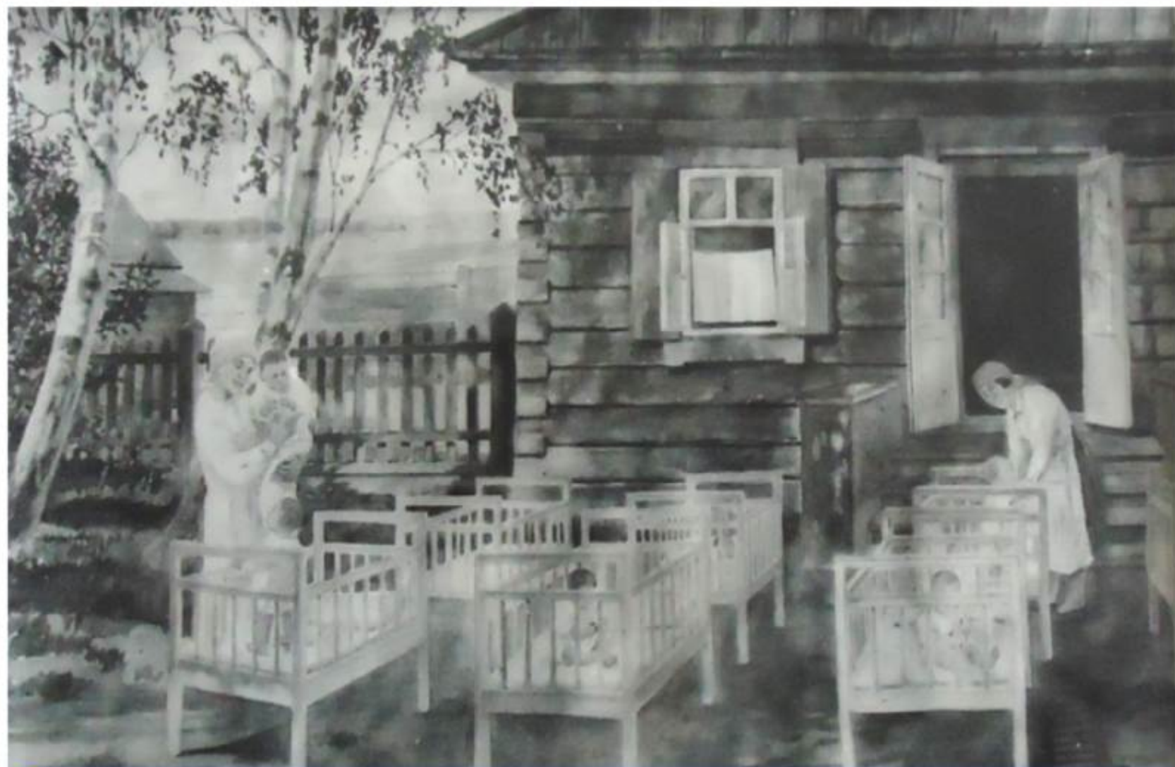
Детские ясли в бывшем доме Переваловых